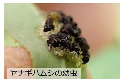
ヤナギハムシの幼虫