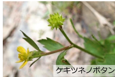
ケキツネノボタン