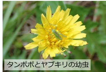
タンポポとヤブキリの幼虫