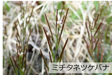
ミチタネツケバナ