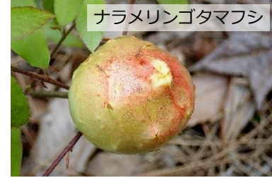
ナラメリンゴタマフシ