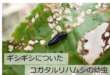
ギシギシについた