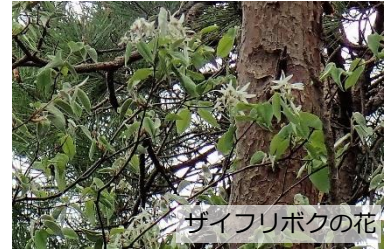
ザイフリボクの花