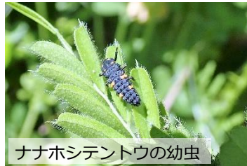
ナナホシテントウの幼虫