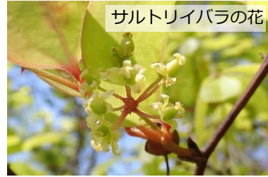
サルトリイバラの花