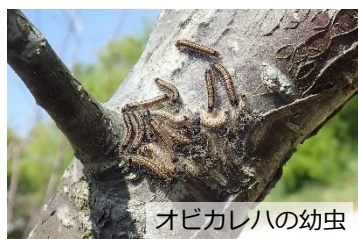
オビカレハの幼虫