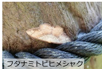
フタナミトビヒメシャク