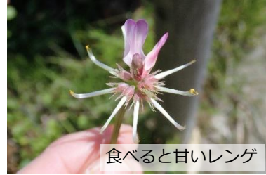
食えると甘いレンゲ