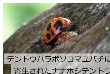
テントウハラボソコマユバチに寄生されたナナホシテントウ