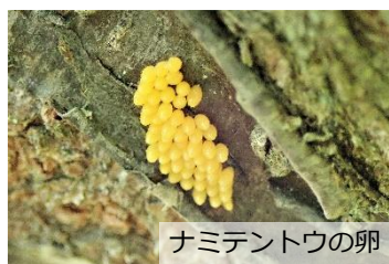
ナミテントウの卵