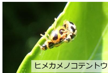
ヒメカメノコテントウ