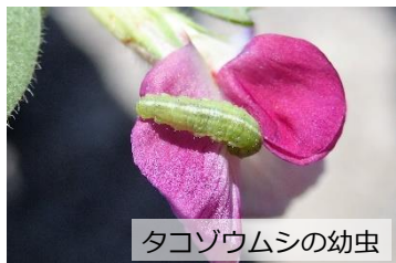
タコゾウムシの幼虫