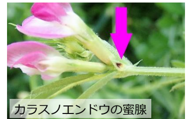
カラスノエンドウの蜜腺