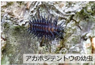
アカホシテントウの幼虫