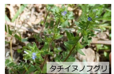
タチイヌノフグリ