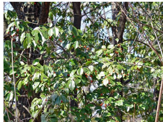
赤い実をつけたソヨゴ

水田の畦には、白い小さな花を付けたタネツケバナ(種漬花, アブラナ科)や枯れたシロバナサクラタデ(白花桜蓼, タデ科)がありました。沢山のモグラ塚もありました。綿がはみ出しているようなガマ(蒲, ガマ科)の穂も観察しました。因幡の白ウサギの話は、もう子供達は知らないだろうということになりました。白っぽく見える実を枝につけたシンジュ(神樹, ニガキ科)は、近くの幹と枝だけのコナラ(小楢, ブナ科)やアベマキ(阿部楨または楢, ブナ科)と比べて特徴的でした。