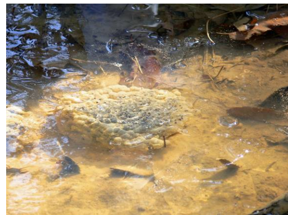
ニホンアカガエルの卵塊

9:50に平和公園に向けて出発しました。蛙の卵を採取するために、里山の家で3つの網の準備をしました。その後、里の道を通って平和公園に入りました。里の道の両側の畑に植えられた元気のない薄黄緑色のナノハナ(菜の花, アブラナ科)は、周辺を濃緑のカラスノエンドウ(烏野豌豆, マメ科)にすっかり取り囲まれていました。最初、囲んでいるのはヤハズソウ(矢筈草, マメ科)ではないかという参加者もいました。カラスノエンドウもまだ背が低いので、スズメノエンドウ(雀野豌豆, マメ科)やカスマグサ(かす間草または烏雀間草, マメ科)との区別は難しいようでした。山側の畑では、実を付けた枯れたハブチャ(波布茶, マメ科)もありました。