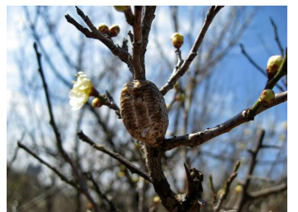
ウメの枝についたカマキリの卵鞘