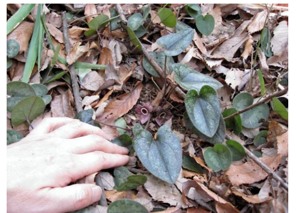
スズカカンアオイの花と葉