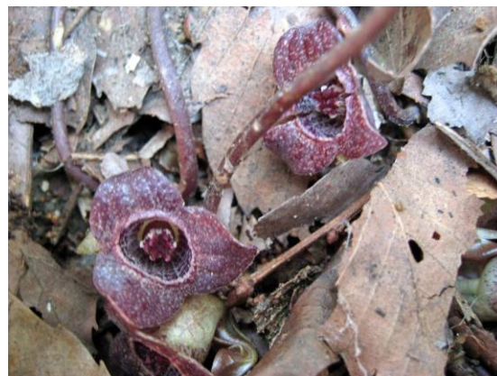
ヒメカンアオイの花