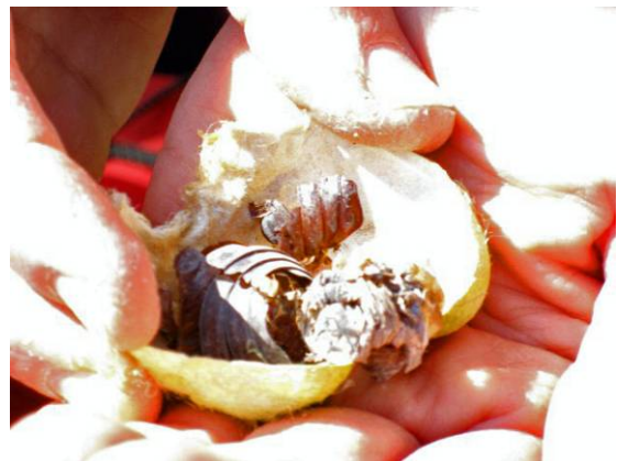
ヤママユガのまゆの中身

http://blog.goo.ne.jp/westmac/e/dc952551e50505d9ef6ae7efad971f74