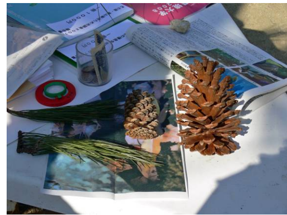
ダイオウショウとテーダマツの松ぼっくりと葉

まず、参加者が持ってきたダイオウショウ(大王松, マツ科)とテーダマツ(Pinus taeda, マツ科)の松ぼっくりと葉を観察しました。ダイオウショウの15cm以上の大きな松ぼっくりは、沖縄で1000円で売られていたそうです。ダイオウショウの針葉は20cm以上の長さがありました。テーダマツの松ぼっくりはダイオウショウの半分以下の大きさでしたが、うろこ部分が尖っており持つと痛い思いをしました。日本の普通のマツの針葉は2本一組ですが、北米原産のダイオウショウとテーダマツの針葉は3本一組でした。後で調べると、サンコノマツ(三針の松, マツ科)が3本一組として有名なようです。テーダマツの漢字表記を聞いた人がいましたが、英名でそのまま呼ばれているので、漢字表記はないようです。