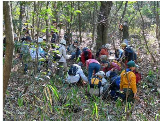
カンアオイの観察