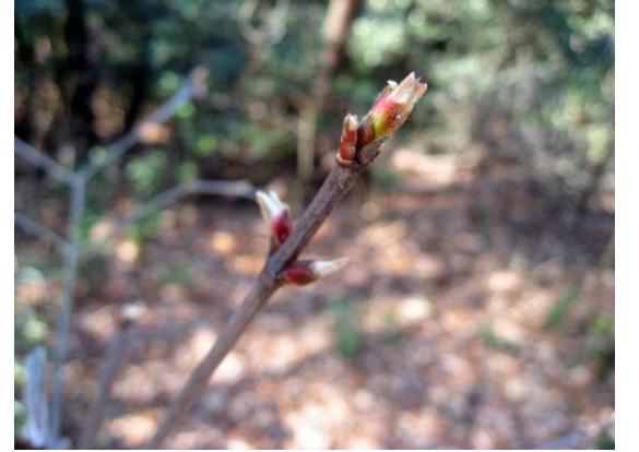
ミヤマガマズミの新芽