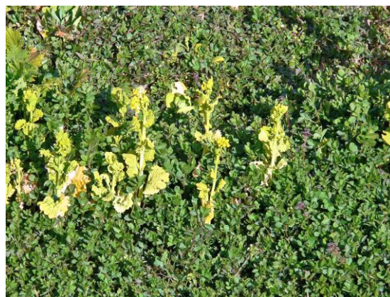
カラスノエンドウに囲まれたナノハナ

カンアオイ(寒葵, ウマノズクサ科)の葉に付いたギフチョウ(岐阜蝶, アゲハチョウ科)の卵の写真の説明を聞いていたときに、ボーイスカウトの人達が離れていたため、リーダーが全員集合という号令をかけました。先月と同じく持ち込まれたヤママユガ(山繭蛾または天蚕, ヤママユガ科)のまゆの抜け殻を観察して、子供達に何であるか知っているかを聞いたところ、カマキリの卵という答えがありました。はさみでまゆを切り裂いて中身を確認すると、さなぎの脱皮殻が残っていました。先月の記録を見て、その後、新池開堀報告書と灯火採集の報告についても話がありました。