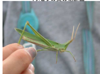
ショウリョウバッタの機織動作

参加者の1人が作ってきた紙飛行機を子供の前で飛ばしました。これで出発しようとしたのですが、子供達が周辺で沢山のバッタを捕ってきたので、それらを観察することになりました。まず、トノサマバッタを見て、クルマバッタとの違いは羽を広げて模様を調べないと分からないという指摘があり、羽を広げてみて、模様がないのでトノサマバッタの雄であることを確認しました。何故、トノサマバッタかという質問に、立派であるのでという男の子の回答がありました。この子は、このトノサマバッタをほしいなほしいなと言っていました。次にショウリョウバッタを観察して、足の先を持って機織りのように動くのを確認しました。高齢の参加者から、持つ場所を間違えると足が折れてしまうという注意がありました。そういえば子供の頃、不注意で多くのバッタの足を取ってしまったことを思い出しました。虫がこの中のクビキリギスとクサキリの区別について、口が赤い(口紅のある)のがクビキリギスで、緑(または褐色)なのがクサキリということでした。オンブバッタ、ハラビロカマキリ、アブラゼミも観察しました。