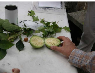
キカラスウリの実の切断面

昨夜の大雨で足下が心配でしたが、平和公園はほとんどぬかるんではいませんでした。曇りで、湿度は高かったですが、風が吹くと8月の真夏とは思えないほど集合場所の木陰は気持ちのよい日でした。新池の水面は、先月よりさらにスイレンなどで覆われましたが、久しぶりにカワセミが飛び、周辺のサルスベリの花がきれいでした。センダンの実は、まだ緑色ですが、大きくなっていました。また、クマゼミの鳴き声がうるさい程でした。参加者は、男の子6名、女の子5名の子供を含む51名でした。夏休みで、子供達の参加が多く、昆虫や植物が豊富なため、密度の濃い観察会になりました。