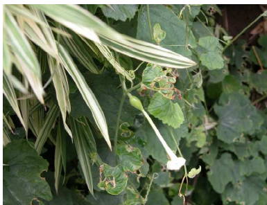
カラスウリの雌花

いつものカラスウリ(烏瓜, ウリ科)の観察場所で、雄株のしおれた雄花と雌株の同じようにしおれた雌花を観察しました。雄株には沢山の雄花がついており、雌株の場合は離れて雌花がついており、花の付け根に緑色の子房の固まりがありました。雌株には、既に大きな実を付けているものもありました。果肉を食べた参加からは、キカラスウリと同じようにめちゃくちゃ苦いという感想がでました。