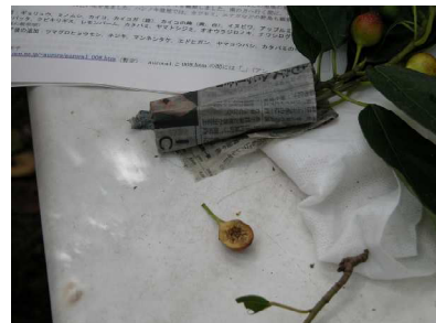
イヌビワの実の切断面

コガタスズメバチの死骸を観察しましたが、他のスズメバチと比較すると性質はおとなしいようですが、庭木や公園に巣を作ることが多く、剪定などで巣を刺激すると激しく攻撃してくるので、被害が多いようです。