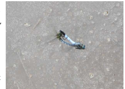
つがいのシオカラトンボ

近くの湿地とその周辺で、シロバナサクラタデ（白花桜蓼、タデ科）、サギソウ（12株、鷺草、ラン科）、ミソハギ（襖萩、ミソハギ科）、ミズギボシ（水擬宝珠、ユリ科）、ヌマトラノオ（沼虎の尾、サクラソウ科）、リョウブ（令法、リョウブ科）を観察しました。シラタマホシクサが無かったのが残念でした。子供達が捕ってきたツクツクボウシ、キイロコウラコマコバチ（？）、ヤマトシジミも観察しました。ツクツクボウシは、今年は少し早いように思いました。子供の頃、この鳴き声を聞くと、夏休みの終わりを告げ宿題をやったかというように聞こえ、いやだった思い出があります。ヤマトシジミの食草であるカタバミ（片喰、カタバミ科）がやはり近くにあって、先月と同じように10円玉で錢磨きをした子供達がいきました。