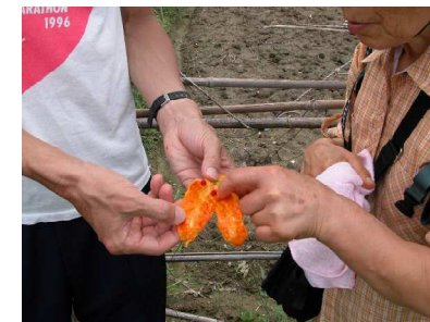
ニガウリの熟れた実

少しあぜを進んだ畑で栽培されているニガウリ(苦瓜, ゴーヤ, ツルレイシ, ウリ科)、エビスグサ(夷草, マメ科)およびヒョウタン(瓢箪, ウリ科)を観察しました。ニガウリは、黄色く熟