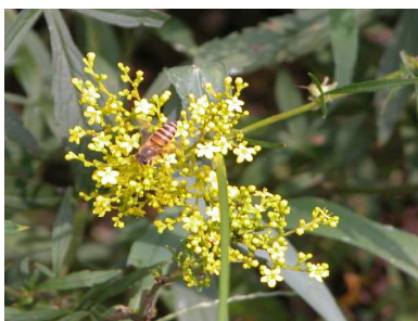
オミナエシとニホンミツバチ

平和公園に入ってすぐの畑でオミナエシ(女郎花, オミナエシ科)を観察しました。においというより臭いという参加者がいました。糞っぽいとかトイレの臭いという参加者もいました。ニホンミツバチ、アオスジハナバチやクマバチが、オミナエシの花の蜜や花粉を採っていました。アオスジハナバチは捕虫網で採って、観察ビンに入れて観察しました。青と黒の筋が非常にきれいでした。