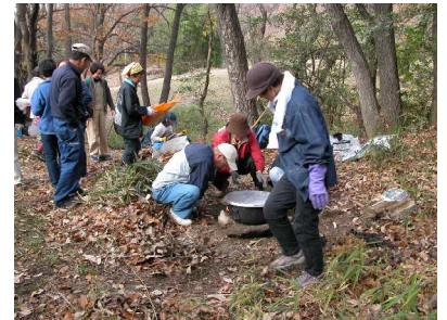
芋煮のかまど造り

芋煮は、まず鍋に水を半分入れ、すぐに里芋(8.5kg)を入れて、かなり煮えてから、こんにゃく(5丁)、ゴボウ(6本)、豚肉(3kg)、豆腐(5丁)、シイタケを入れ、お酒と醤油だけで味付けしました。最後に葱(1把)を入れて完成させました。途中で灰汁を丹念にとりました。各自がお椀にとり、ユズを少