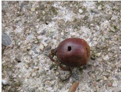
虫に食べられたアベマキのドングリ

まず、いつもの集合場所の元清風荘前の公園で、先月の観察記録を使って報告がありました。カロライナジャスミンは、キャロライナジャスミンと言うのではないかという問いに、両方とも使われるという回答がありました。ちなみに、Googleで検索するとカロライナジャスミンは4090件、一方キャロライナジャスミンは487件ですので、カロライナジャスミンの方が一般的なのでしょう。観察記録の写真の中で、ドングリのコナラシギゾウムシの産卵穴が見にくいという意見が出ました。露出がたらなかったようです。今回の観察会でもう少しよい写真を撮りました。キクイモについては、先週採ったものを赤味噌とみりんできいて食べてみて、おいしかったという報告がありました。アサギマダラのマーキングについての子供の参加者の作文が12月5日の中日新聞に掲載されたという報告もありました。