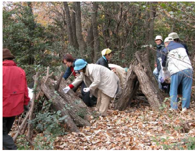
愛護会のシイタケ栽培