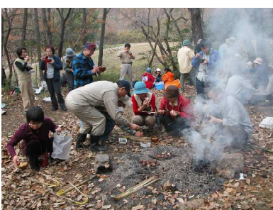
芋煮会の食事風景