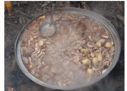
具たくさんの芋煮