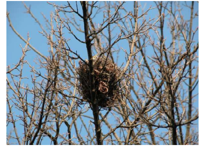
トウカエデの枝に残された鳥の巣