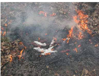
サツマイモの焼き火への投入