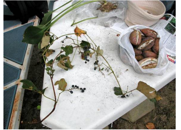
エビズルとミツバアケビの実