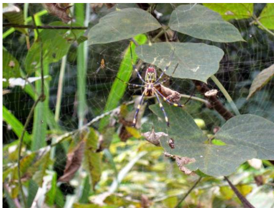
ジョロウグモの雌と雄