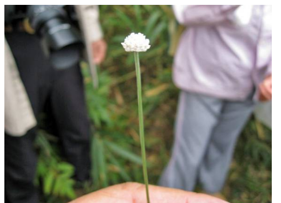
ねじれた茎を持つシラタマホシクサ