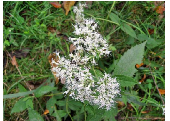
ヒヨドリバナの花