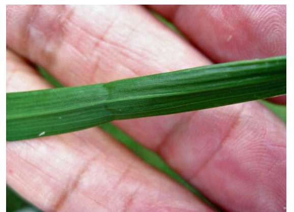
カゼグサの葉のへそ