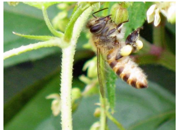
花粉を抱えたニホンミツバチ