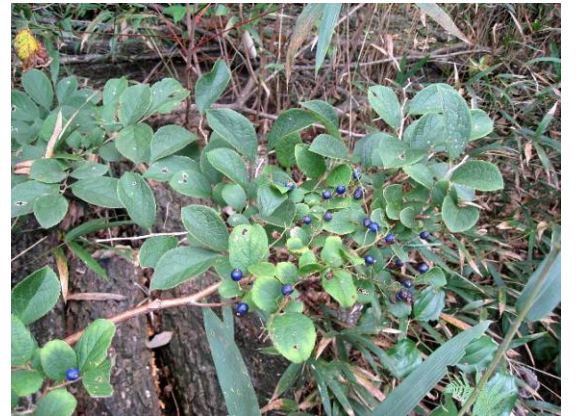
青い実のついたサワフタギ